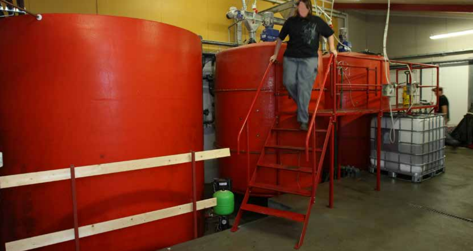
Foto viser en god arbejdsplatform og rækværk til at forhindre nedstyrtning/fald ved vådfodertank.